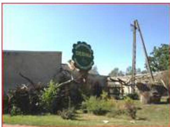
Fotografia 1. „Dębina”, źródło: www.debina.yoyo.pl

Gospodarstwo Agroturystyczne „Dębina” usytuowane jest w lesistej i pagórkowatej okolicy, pochylonej ku Dolnie Noteci w miejscowości Sarbka na trasie Czarnków – Ujście w kierunku Piły. Tradycje swego istnienia, nierozłącznie związanego z hodowlą koni, czerpie już od wielu pokoleń, rzec można od wieku (z czasów sprzed I wojny światowej). Teraz kultywuje ją czwarte i