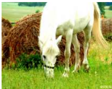
Fotografia 2. Wenus

Spośród ośmiu koni mieszkających w „Dębinie” trzy zostały przeznaczone, w wyniku odpowiedniej selekcji i obserwacji, do zajęć hipoterapeutycznych. Przygotowanie odbywało się w czasie trzymiesięcznego treningu, podczas którego przyzwyczajało się konia do: różnorodnych zmian pozycji ciała osoby na jego grzbiecie, oklepywania jego różnych części